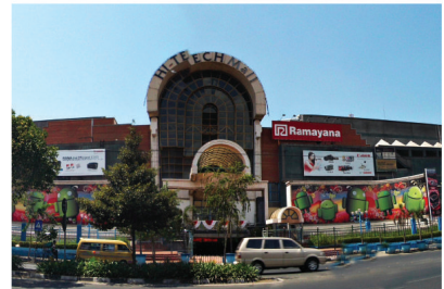
THR MALL SURABAYA ELECTRICAL INSTALLATION