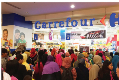
CARREFOUR MALL ELECTRICAL INSTALLATION