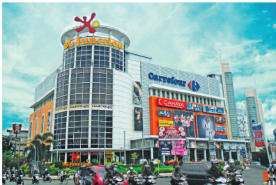
BG JUNCTION ELECTRICAL INSTALLATION