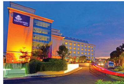
HOTEL INA MUARA PADANG ELECTRICAL INSTALLATION