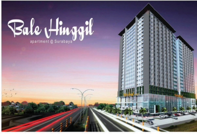
APARTMENT BALE HINGGIL ELECTRICAL INSTALLATION