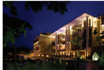
ANANTARA SEMINYAK, BALI ELECTRICAL INSTALLATION