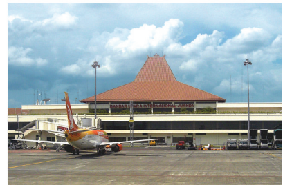
IR.H.JUANDA AIRPORT ELECTRICAL INSTALLATION