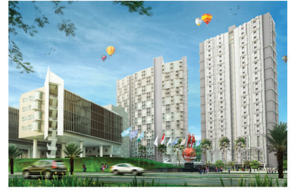
APARTMENT SEKOLAH CIPUTRA ELECTRICAL INSTALLATION