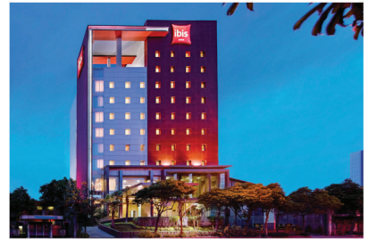
HOTEL IBIS SURABAYA ELECTRICAL INSTALLATION