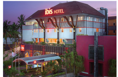
HOTEL IBIS BALI ELECTRICAL INSTALLATION