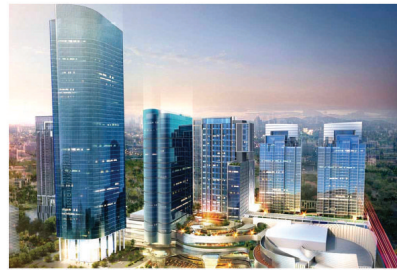
APARTMENT CIPUTRA WORLD ELECTRICAL INSTALLATION