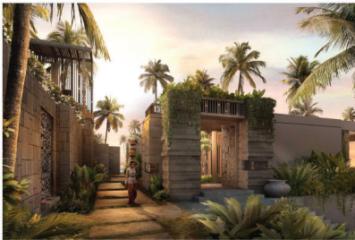
HOTEL ROSEWOOD BALI ELECTRICAL INSTALLATION