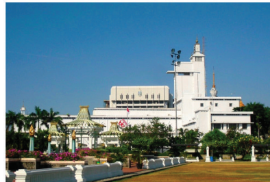
KANTOR GUBERNUR JATIM ELECTRICAL INSTALLATION