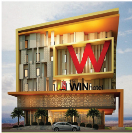
HOTEL WIN SURABAYA ELECTRICAL INSTALLATION