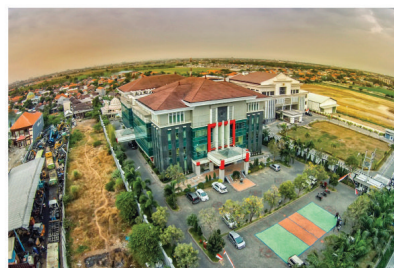
KANTOR DIRJEN PAJAK JATIM II ELECTRICAL INSTALLATION