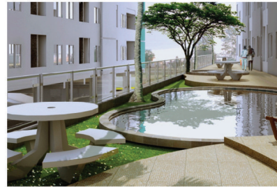
APARTMENT PAVILION PERMATA 1&2 ELECTRICAL INSTALLATION